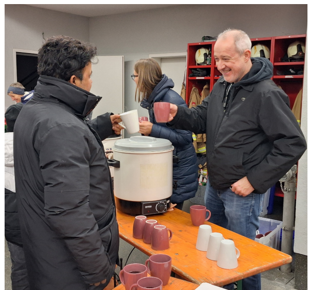
Am Sonntag, 7. Dezember 2025 wurde in der Filiationkirche Holzhausen das Patrozinium gefeiert. Anschließend lud die FFW Holzhausen zu einem Umtrunk ins Feuerwehrhaus ein.