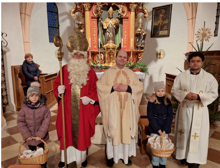
Am Samstag, 6. Dezember 2025 wurden alle Kinder der Pfarre zur Nikolausfeier in die Filiationkirche Holzhausen eingeladen. Vom Hl. Nikolaus erhielt jedes Kind ein kleines Geschenk.